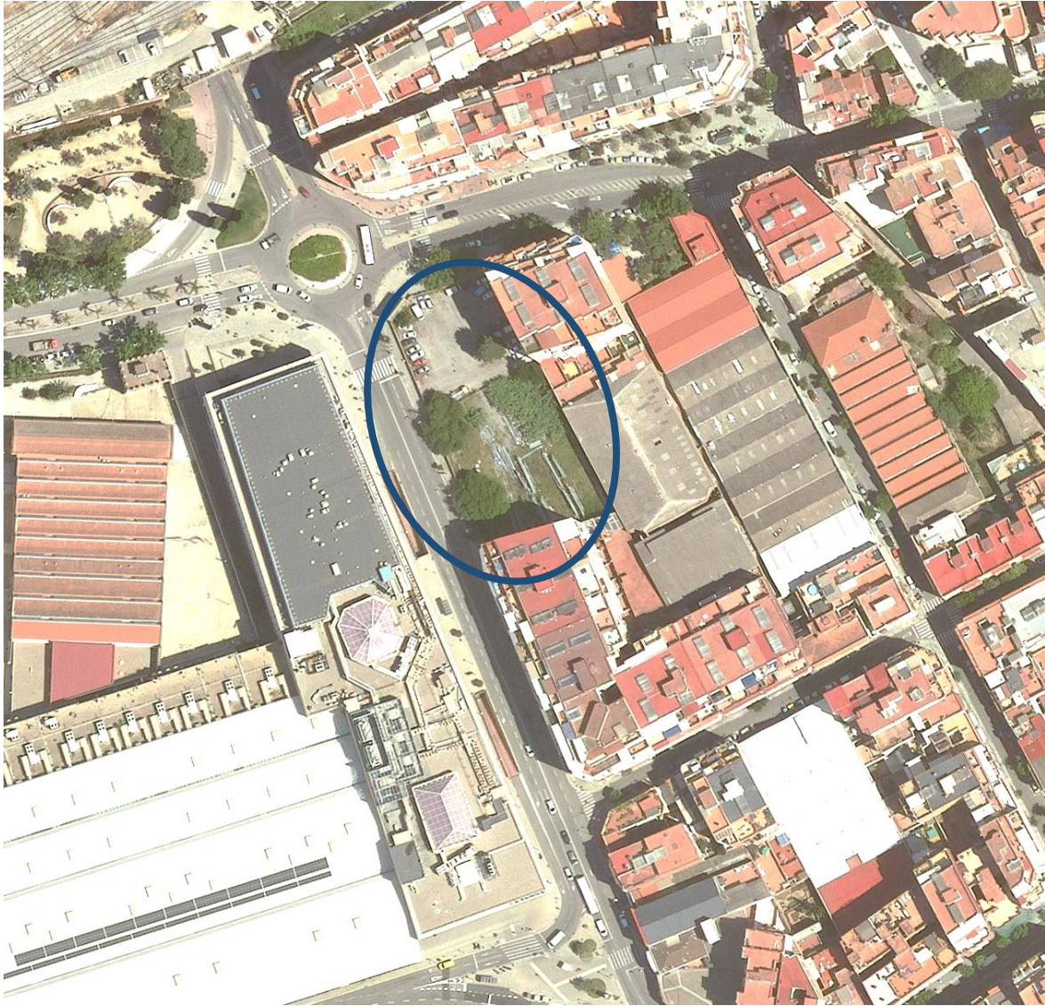
Parcel·la a l'encreuament de les avingudes Josep Tarradellas i Isabel la Catòlica