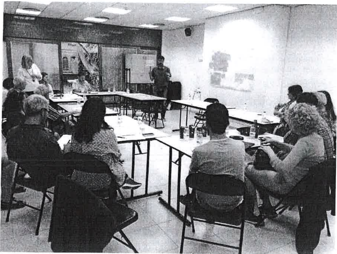
Fotografia de la dinàmica de la sessió. Els i les participants debaten sobre les propostes de millora de participació del Consell municipal de Serveis Socials.

Una altra proposta que sorgí va ser vehicular la participació per temes puntuals o objectius, i no per àmbits (Taules sectorialitzades), per tal d'aprofundir en els temes des d'una perspectiva integral i en base a projectes concrets amb inici i final. Per últim, es proposà visualitzar les fites assolides per les entitats, per dóna'ls-hi valor al Consell de Serveis Socials i davant el conjunt de la ciutat.